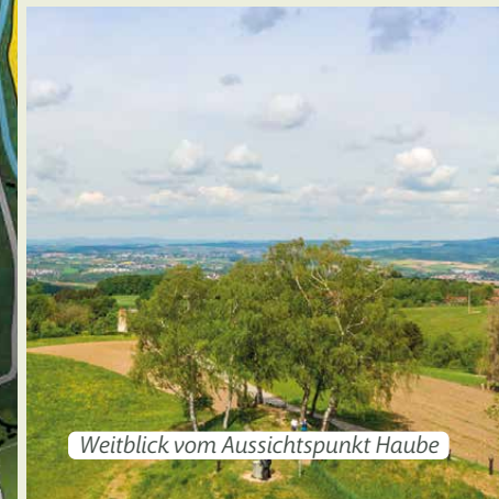
Weitblick vom Aussichtspunkt Haube