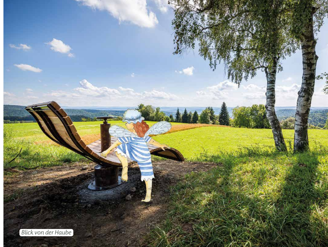
Blick von der Haube