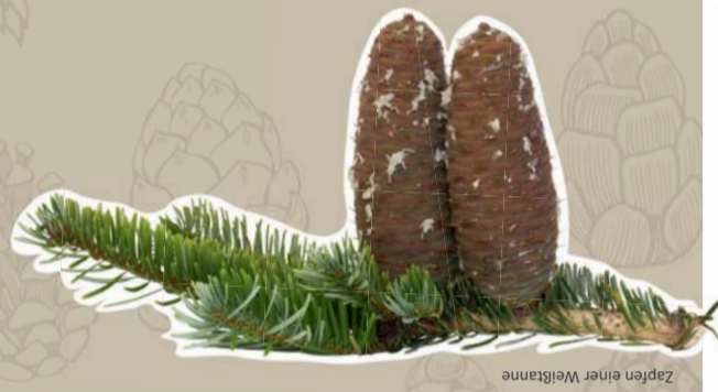
Zapfen einer Weißtanne